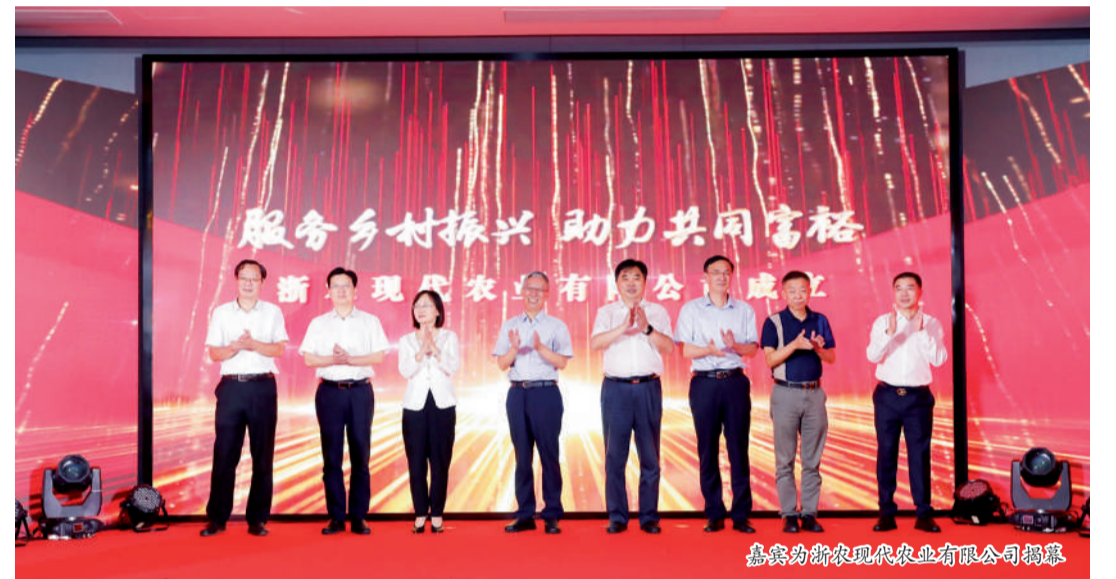
嘉宾为浙农现代农业有限公司揭牌

9月14日,“政企共推农业高质量发展”高峰论坛暨浙农现代农业有限公司成立仪式在浙农科创园举行。全国政协委员、中国农资流通协会会长杨建平,浙江省供销社党委书记、理事会主任邵峰,中华全国供销合作总社农业生产资料与棉麻局局长、中国农资流通协会常务副会长龙文,浙江省农业农村厅二级巡视员王建伟,省金融控股有限公司党委书记、董事长章启诚,浙江农林大学副校长吴家胜,浙江省农业科学院院长助理孙国仓,浙农集团股份有限公司董事长包中海共同为该公司成立揭牌。活动由浙农股份总经理林昌斌主持。 浙江省供销社社党委书记、监事会主任童日晖宣读了8月18日时任浙江省人民政府副省长刘小涛同志在浙农股份关于《推进系统大联合、供销社的组织体系优势,将现代农业社会化服务工作深度融合到“三位一体”改革中,办好浙农现代农业有限公司,创新服务机制、健全服务体系,提升服务绩效,为我省建设农业农村现代化先行省、高质量发展建设共同富裕示范区作出新的贡献。 随着现代农业发展和土地流转的推进,农业组织形式和生产方式发