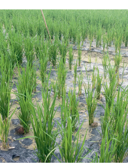
萧山所前镇示范区内,“星光牌”全生物降解地膜使用50天左右已开始降解

地膜,上世纪70年代被引入我国以来,以其保温保墒、覆盖除草等显著优势,逐渐成为农业生产中必不可少的生产资料。但由于长期大规模使用却得不到有效回收,曾经风光无限的“致富膜”成了散落田间的“白色污染”。据专业研究显示,普通PE地膜在土壤中自然降解时间超200年。破损的农膜残留在土壤中,会引起土壤板结,影响作物生长,也对农业机械化作业产生了较大障碍,还易被牛羊等家畜误食造成肠胃功能不良甚至死亡。