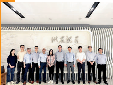
2023年4月以色列化工集团(ICL)代表团访问浙农爱普

者。从初创开始,爱普就以前瞻的视野,不懈的精神和热忱持续付出,打造出了如今的行业声誉与地位。遍布全球的业务,出众的创新能力,以及多样化的投资组合,使得公司在各个阶段都做出了优秀业绩并取得了又一个又一个重要发展硕果。