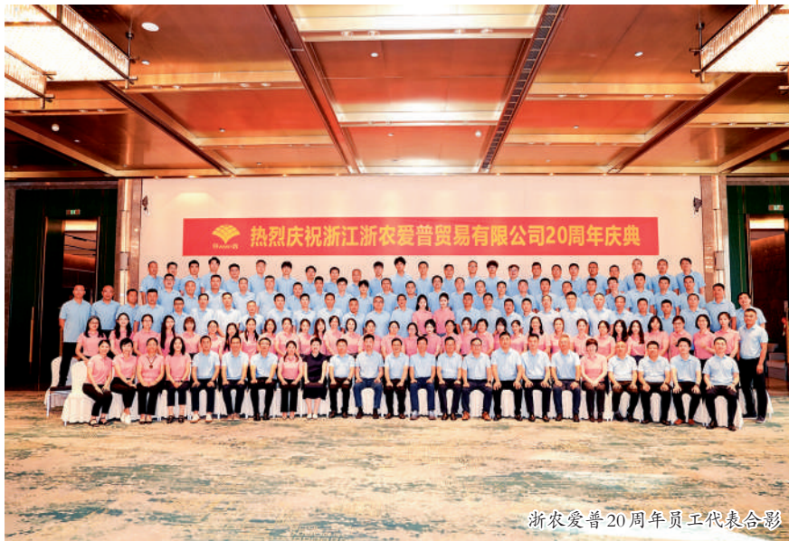
浙农爱普20周年员工代表合影

“乘众人之智,则无不任也;用众人之力,则无不胜也”。为爱普的繁荣成长背书,是这个大家庭中的每一位成员。公司不仅成就了自己的骄人业绩,也汇聚了一大批优秀的业界同伴,组建成一个团结和谐的大家庭,共同推动行业向前进步,助力浙农事业发展。创业情怀激励着每一位追求梦想的爱普人,成就了今日的爱普航母。一支能征善战、勇于担当、敢于拼搏的爱普战队,分布在全国各地,奋斗在为农服务第一线。每一位员工都秉承着团队精神与合作精神,无私地献出了自己的力量。每个